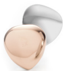
a szív 2400 Gauss

Amennyiben elkezdjük a mágnes terápiát a mágnes ékszerekkel, soha ne hagyjuk abba, hiszen ha, nincs rajtunk, mindennap nem tud hatni, csak akkor, ha viseljük. Az Energetix mágnes a Neodímium örök mágnes (permanens) egyszer kell megvenni.